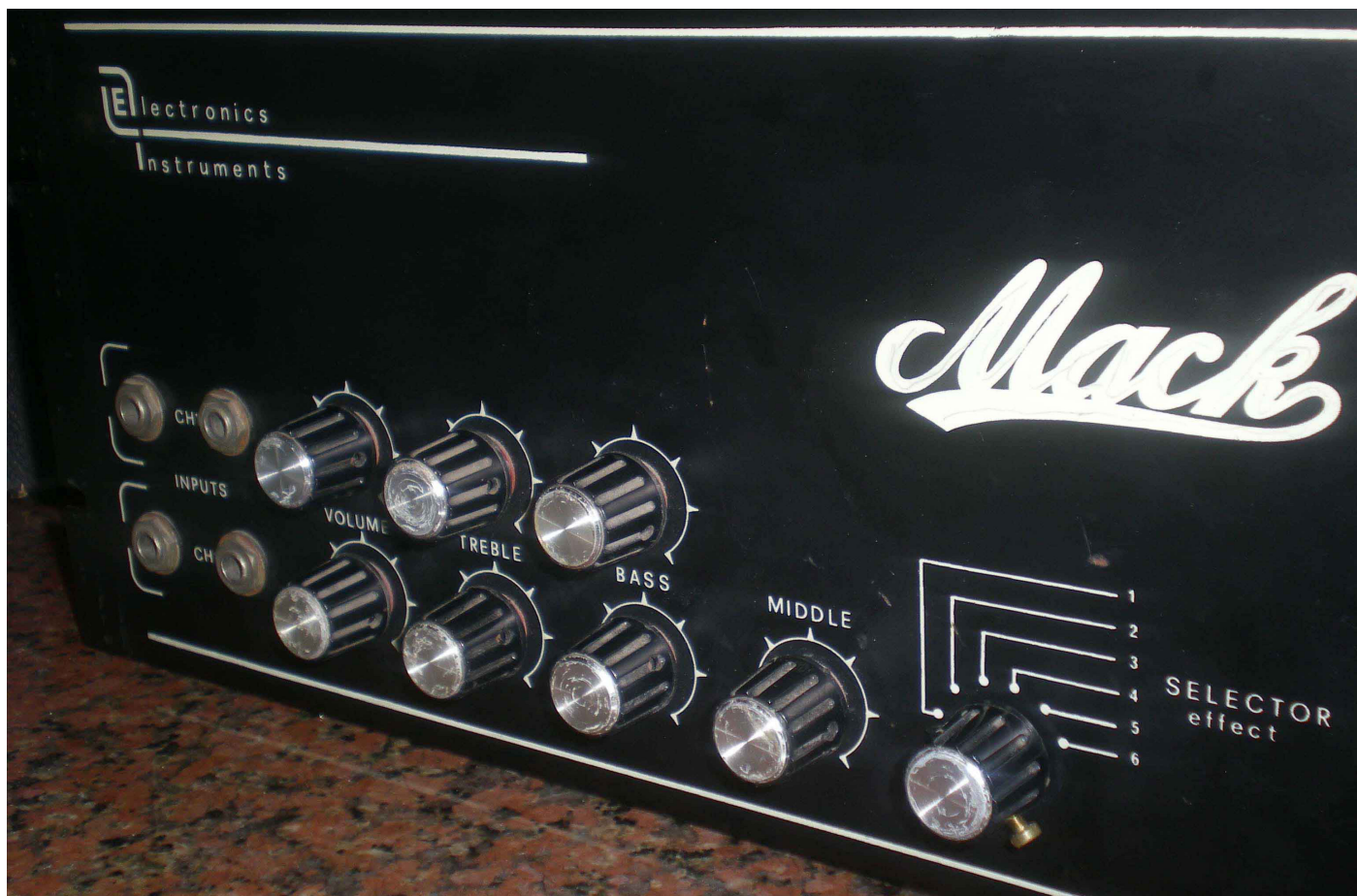
Pannello dei controlli - fronte